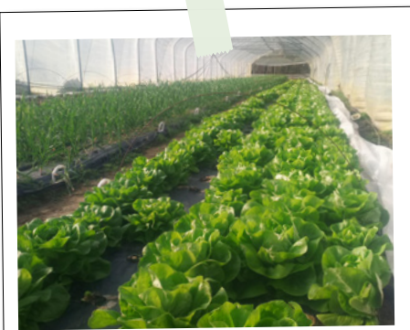
Début des récoltes des salades et ail Primor (25 février)