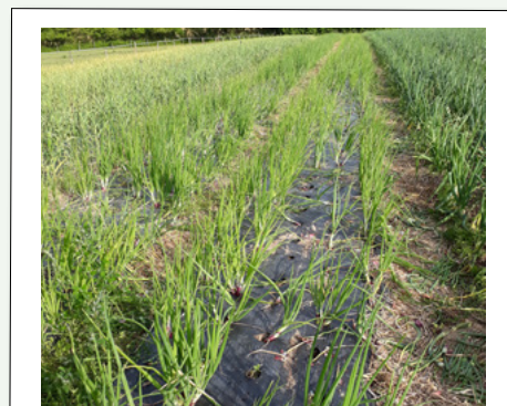
Parcelle alliacées 2019

Pierre cultive en plus de l'ail et des oignon jaunes des oignons blanc et des rouges de Florence, des échalotes : en tout 2000 m 2 d'alliacées