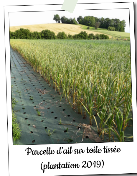
Parcelle d'ail sur toile tissée (plantation 2019)