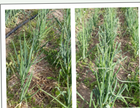
à gauche: planche d'oignons avec couverture paille et à droite sur terre nue (essais 2019)

La couverture avec de la paille n'est pas complètement satisfaisante car